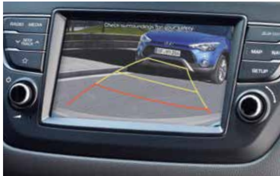
Rückfahrkamera 1 .