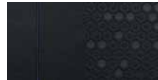
Stoff in Schwarz mit blauen Ziernähten 1 .