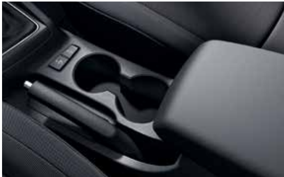
Getränkhalter/Mittelarmlehne mit Ablagefach 1 .