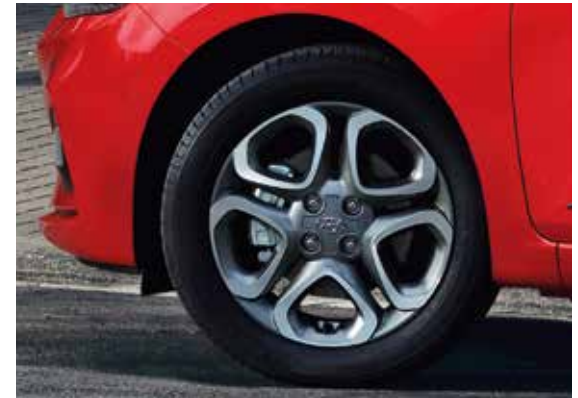
16-Zoll-Leichtmetallfelgen 1 .