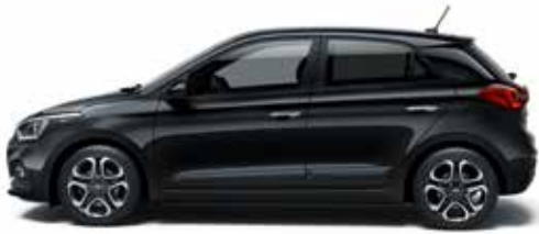
Phantom Black Mineraleffekt¹.