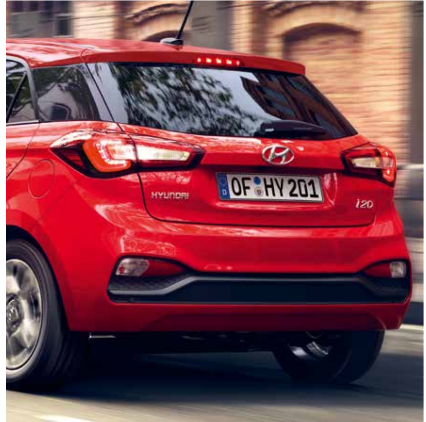
LED-Rückleuchten 1 und Nebelschlussleuchte.