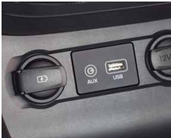
AUX-Anschluss und USB-Anschlüsse. 1

Apple CarPlay™ ist ein eingetragenes Warenzeichen der Apple Inc. Android Auto™ ist ein eingetragenes Warenzeichen von Google Inc.