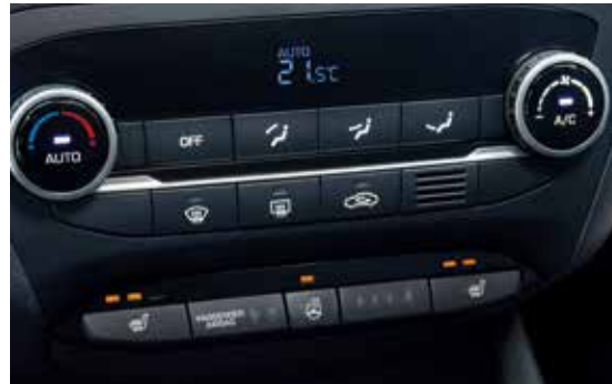
Klimaautomatik 1 .