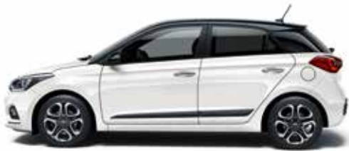
Polar White Uni.