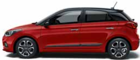
Dragon Red Mineraleffekt.