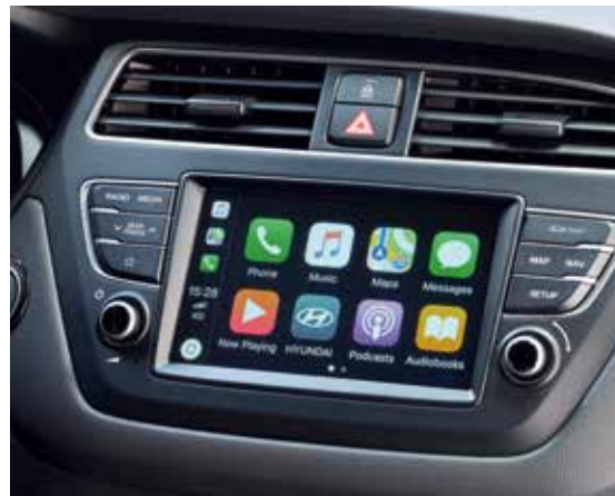
7-Zoll-Touchscreen 1 mit Apple CarPlay™ und Android Auto™.