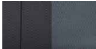
Stoff in Greyish Blue 1 .