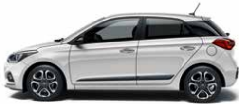
Sleek Silver Metallic¹.