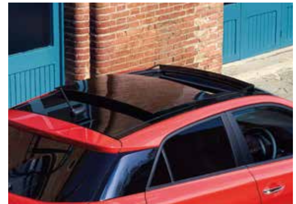
Panorama-Glas-Schiebedach 1 und schwarz glänzende C-Säule.