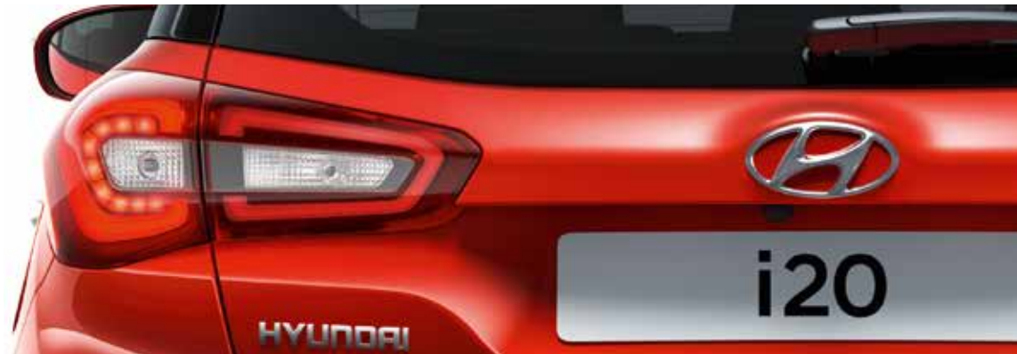
LED-Rückleuchten 1 .