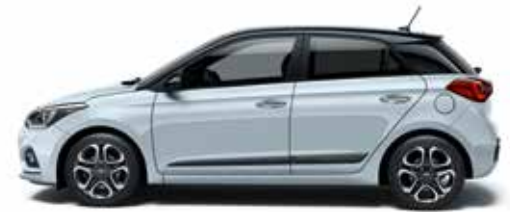
Clean Slate Metallic.