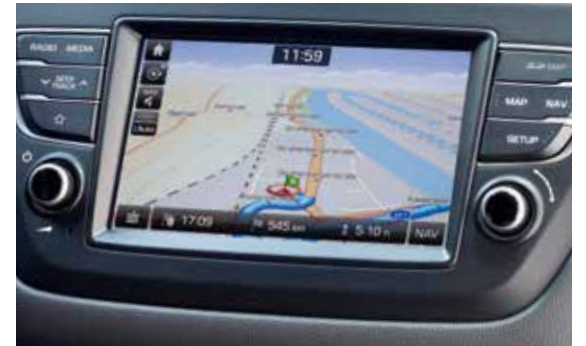
Radio-Navigationssystem 1 .