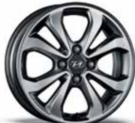
15-Zoll-Leichtmetallfelge 1 .