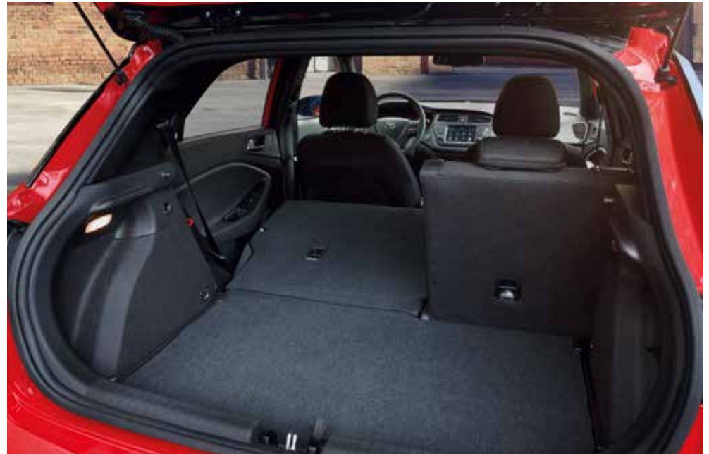
Extra geräumiger Kofferraum durch eine 60 : 40 teilbare Rückbank.

Wir denken, dass Raum kein Luxus sein sollte. Er ist ein Muss. Darum bietet der Hyundai i20 Platz und herausragende Beinfreiheit für bis zu fünf erwachsene Fahrgäste. Wenn es ein wenig mehr Kofferraumvolumen sein soll: Die 60 : 40 teilbare Rückbank kann einfach umgeklappt werden, was das Kofferraumvolumen von 326 auf kompromisslose 1.042 Liter erhöht.