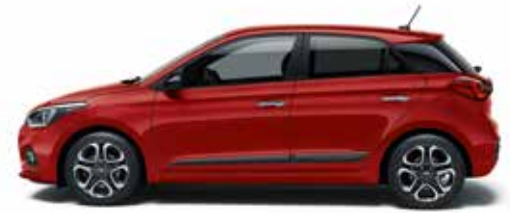
Dragon Red Mineraleffekt¹.