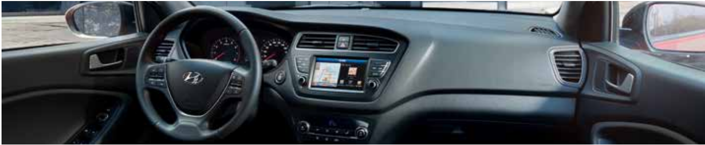
Armaturenbrett in Schwarz 3