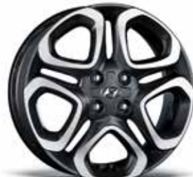
16-Zoll-Leichtmetallfelge 1 .

1 Optional. 2 Enthält hochwertiges Kunstleder. 3 Optional ohne Aufpreis.