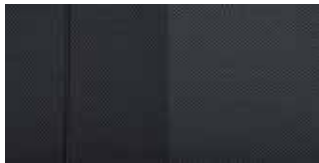
Stoff in Comfort Grey 3 .