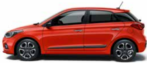
Tomato Red Uni.