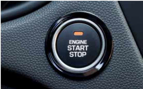
Smart-Key-System mit Start-/Stopp-Knopf 1 .