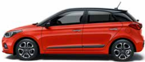
Tomato Red Uni.