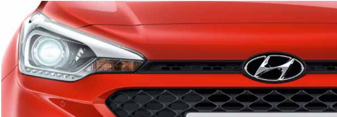
Frontscheinwerfer mit LED-Tagfahrlicht 1 .