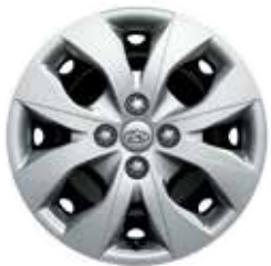
15-Zoll-Stahlfelge mit Radzierblende.