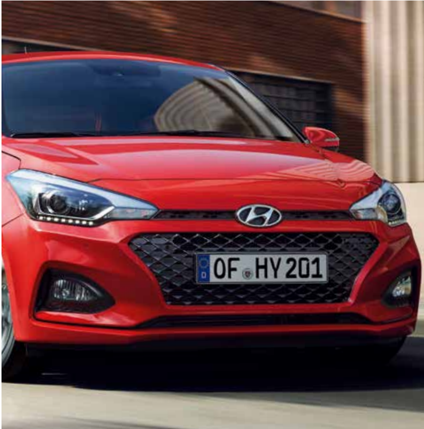
Kaskadengrill und Scheinwerfer mit LED-Tagfahrlicht 1 .

Der neue Hyundai i20 setzt ein Statement mit einzigartigen Details, die durch die neue Hyundai Designsprache für ein sportliches Auftreten sorgen.