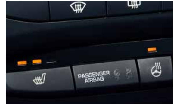
Sitzheizung, vorne/beheizbares Lederlenkrad 1,2 .