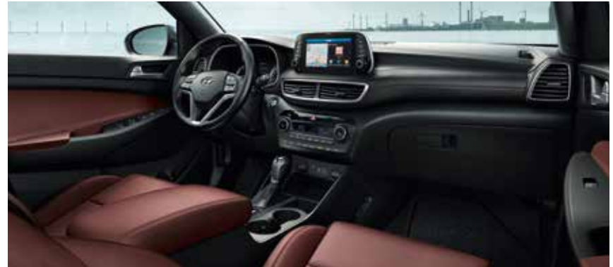
Innenausstattung in Rot mit Dachhimmel in Schwarz