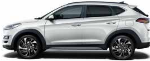
Platinum Silver Mineraleffekt 1