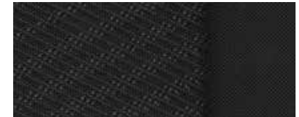
Stoff in Schwarz 1