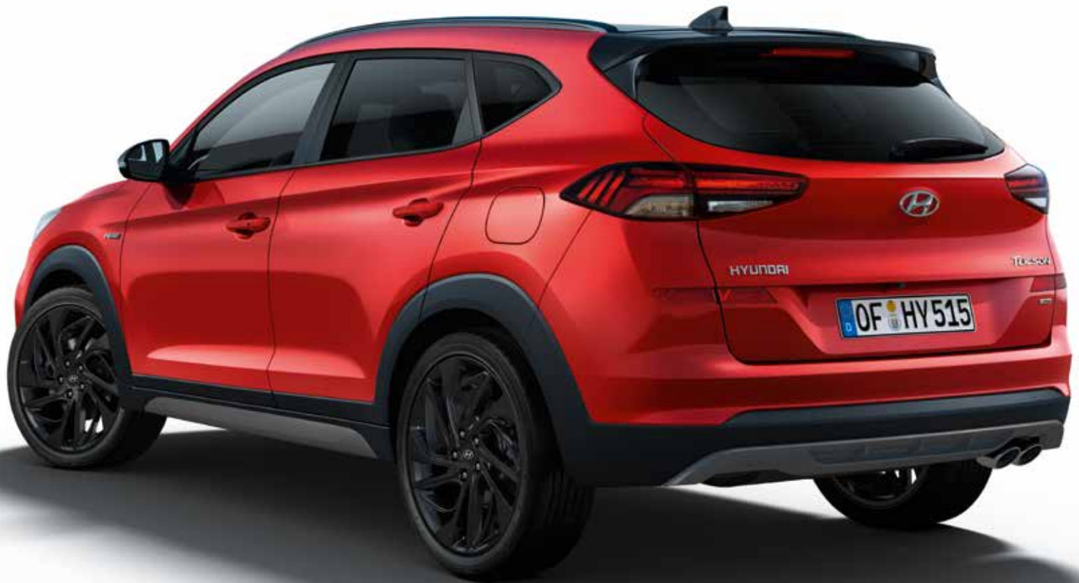
Aerodynamischer Heckspoiler, Dachreling, Außenspiegel und Haifischantenne in Schwarz. Abgasanlage mit ovaler Doppelrohrblende.