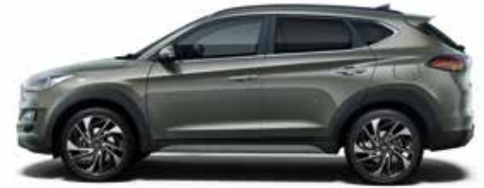
Olivine Grey Metallic 1