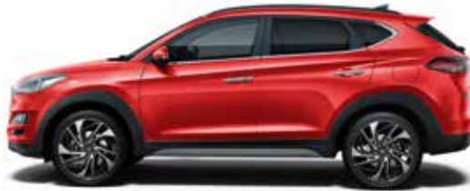
Engine Red Uni