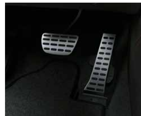
Pedale in der Optik von gebürstetem Aluminium mit Gumminoppen für besseren Halt.