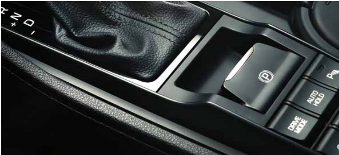
Elektrische Parkbremse 1

Der neue Hyundai Tucson ist mit einer ganzen Reihe durchdachter Funktionen ausgestattet, die zusätzlichen Komfort und Annehmlichkeiten bietet. Die elektrische Parkbremse 1 lässt sich per Fingerdruck aktivieren. In der Mittelkonsole befindet sich nun eine Ablage zum kabellosen Laden Ihres Smartphones 1 . Beim sicheren Einparken unterstützt Sie der Around-View-Monitor 1 mit 360-Grad-Rundumsicht. Das Navigationssystem 1 verfügt über 3D-Landkarten und ein kostenloses 5-Jahres-Abonnement für LIVE Services 2 . Dieses versorgt Sie in Echtzeit mit Informationen zu Wetter und Verkehr und hält Sie so immer auf dem Laufenden.