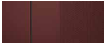
Leder in Rot 1,2