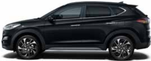
Phantom Black Mineraleffekt 1