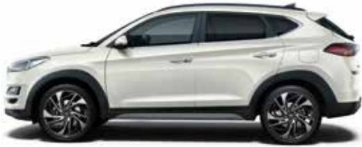
Polar White Uni 1