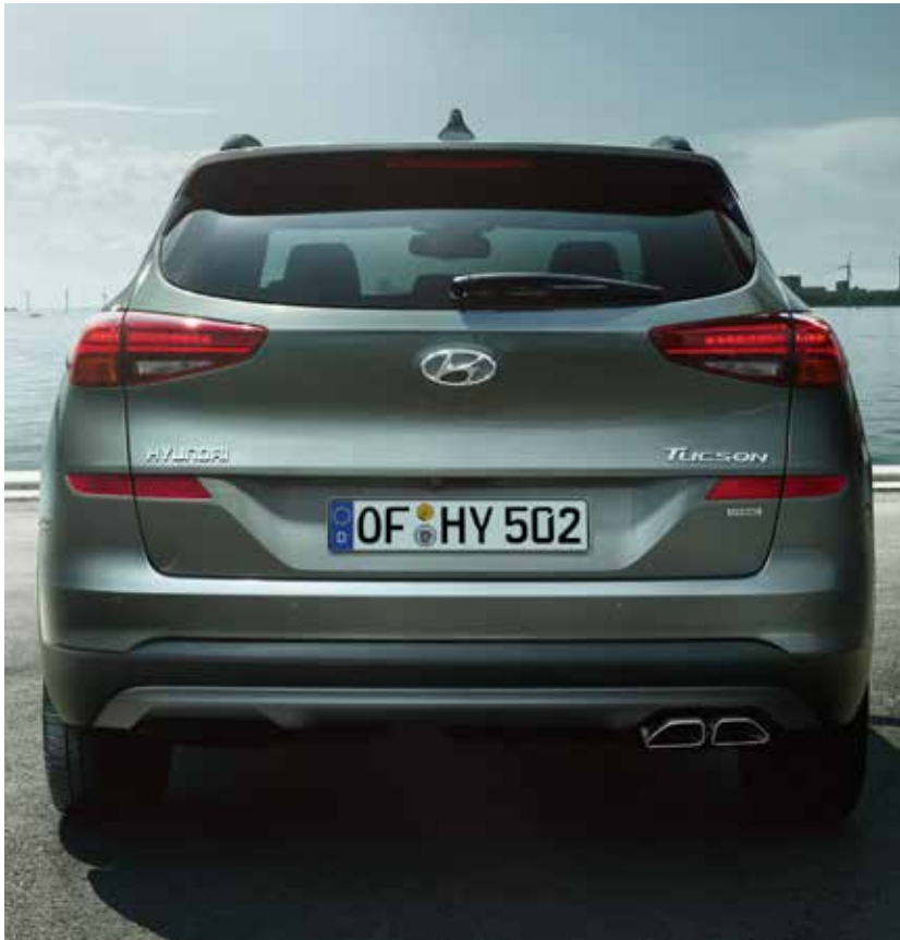
Neu gestaltete Heckschürze und LED-Rückleuchten!