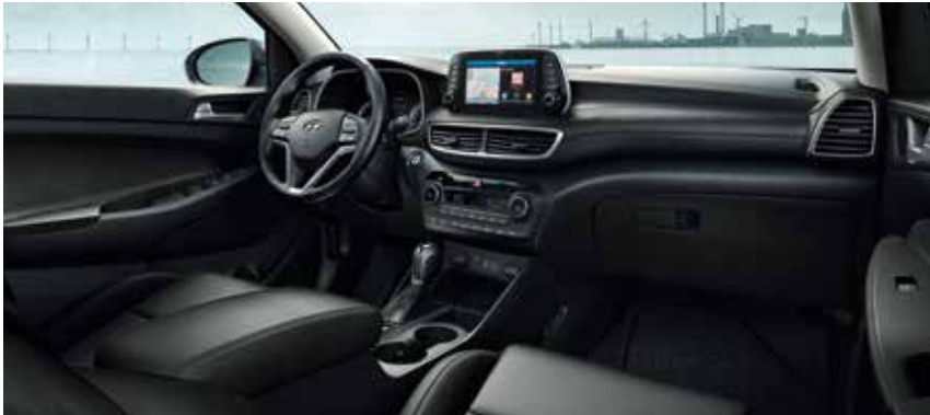
Innenausstattung in Schwarz mit Dachhimmel in Grau