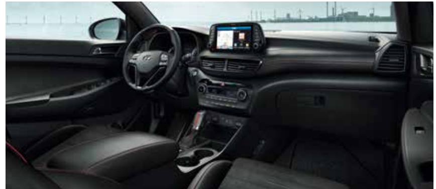
Innenausstattung für N Line in Schwarz mit roten Ziernähten