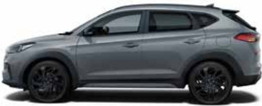
Shadow Grey Uni 1,4