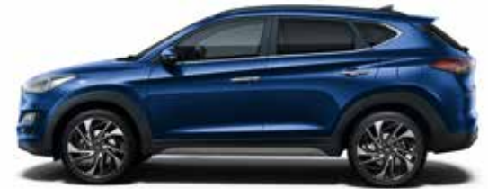
Stellar Blue Metallic 3