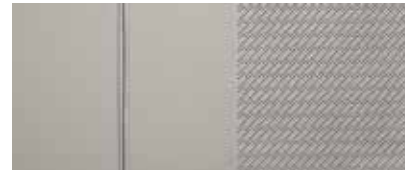
Leder in Grau 1,2